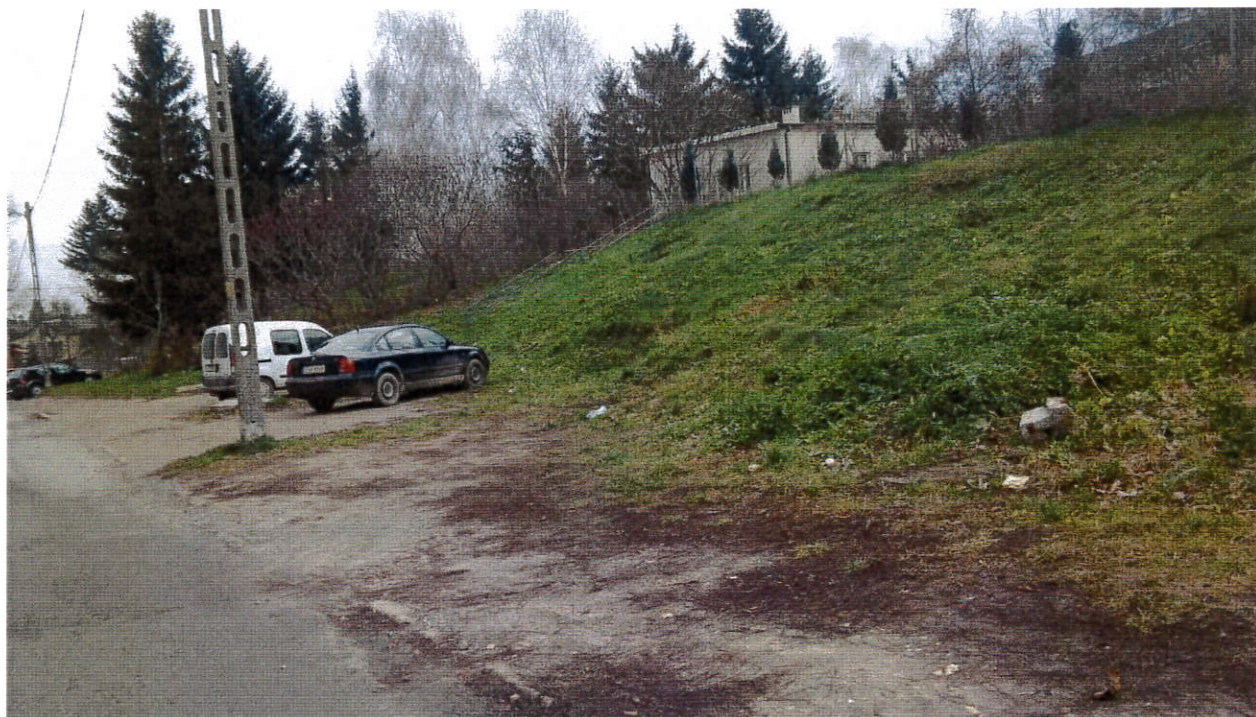
Zawichost, potrzeba kompleksowego zagospodarowania terenu wokół ZSO w Zawichoście