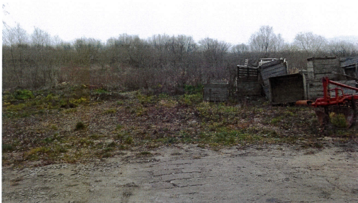
Zawichost, okolice miasta przy Wiśle – potrzeba uporządkowania przestrzeni publicznej