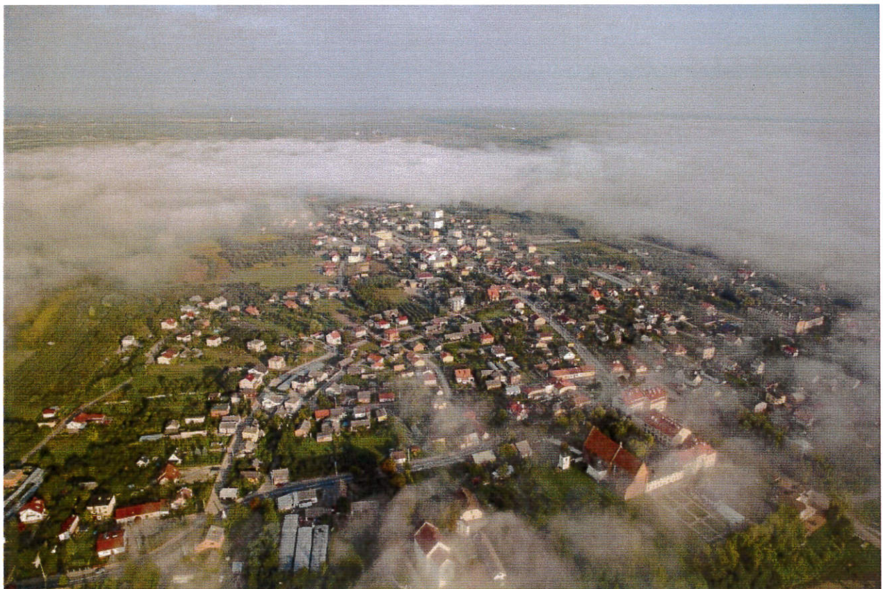
Kielce, listopad 2020

Aneks nr 1 do LOKALNYEGO PROGRAMU REWITALIZACJI MIASTA ZAWICHOST na lata 2016-2022