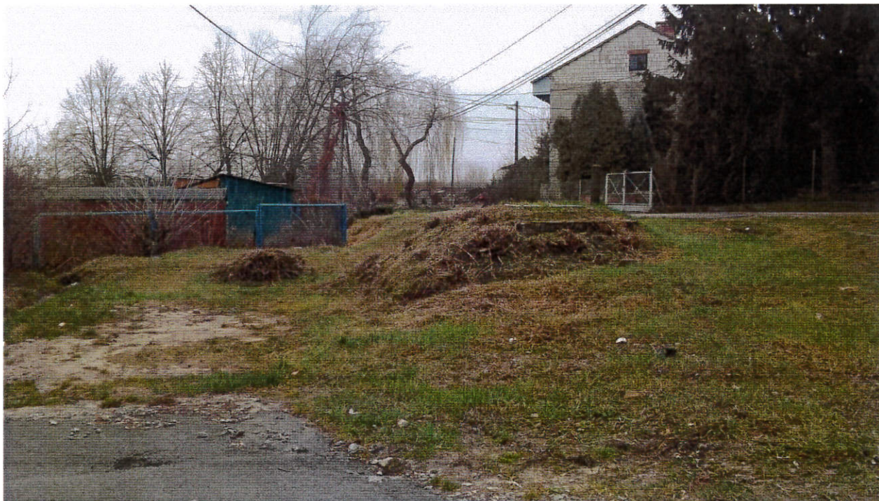
Zawichost, okolice miasta przy Wiśle – potrzeba uporządkowania przestrzeni publicznej