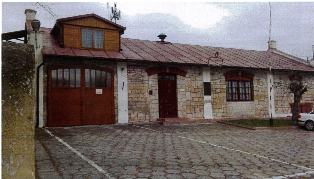
Zawichost, potrzeba kompleksowego remontu zabytkowego budynku OSP w Zawichoście z dostosowaniem do funkcji społecznych