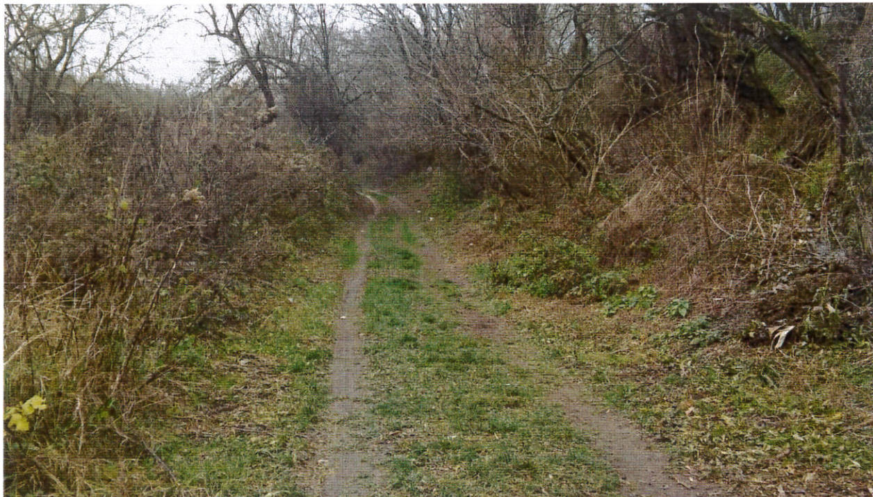
Zawichost, ul. Głęboka – potrzeba przebudowy i zagospodarowania otoczenia wąwozu.